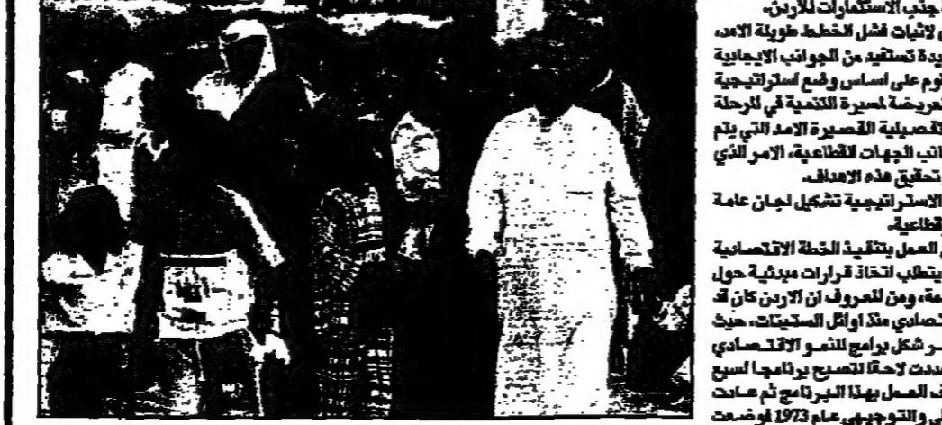
مباح خديجيين يزورون مدينة جرش الاردنية في الأردن